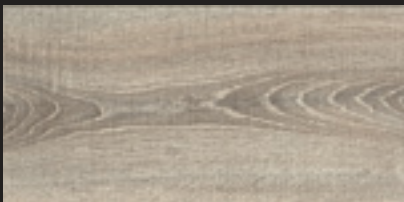
4804 Oak rift grey